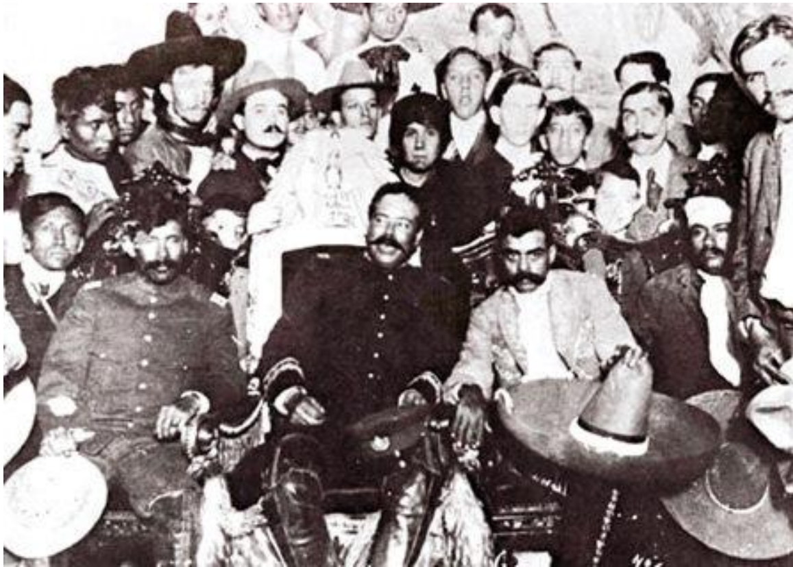
Syndrome de l'armée mexicaine (plus de généraux que de soldats...)