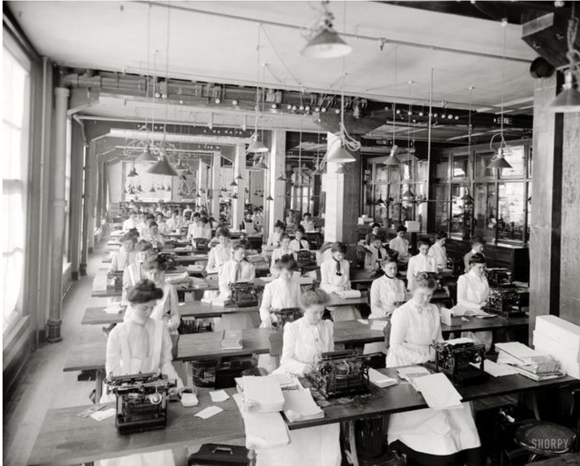
Concept d'usine fantôme (hidden plant) de Feigenbaum